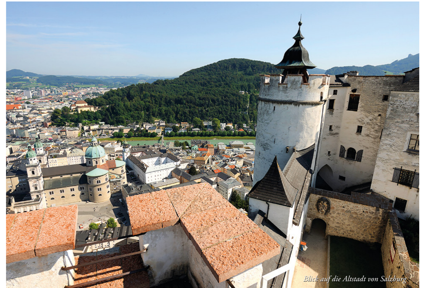
Klick auf die Altstadt von Salzburg

schen Reiches wird. Von Keutschach baut die Festung zu einem vornehmen Regierungssitz aus, um 1500 lässt er die Türme der Festung erhöhen und die große Zisterne anlegen. Der Reißzug, eine Transportanlage, wird errichtet; er ist bis heute die älteste bewirtschaftete Standseilbahn der Welt. 1501 wird der „Hohe Stock“ des Palas zu einem der bedeutendsten Denkmäler spätgotischer Profanarchitektur ausgebaut. Es entstehen die prachtvolle „Goldene Stube“ mit dem grazilen Kachelofen, ein handwerkliches Meisterwerk, und der „Goldene Saal“ mit seinen beeindruckenden Marmorsäulen. Wein- und Rosengärten werden zur Ergötzung des Erzbischofs auf den südlichen Basteien angelegt, im Burghof tummeln sich Dutzende weiße Pfau. Das heute weltweit älteste, immer noch in Verwendung stehende Orgelhornwerk wird errichtet. Die mit einer Walze betriebene Orgel im Krauturm erinnert wie eine Sirene dreimal täglich die Salzburger an die Tageszeit. Da dieser Ton fast wie das Brüllen eines Stiers klingt, wird das Hornwerk bis heute von den Salzburger Bürgern liebevoll „Salzburger Stier“ genannt.