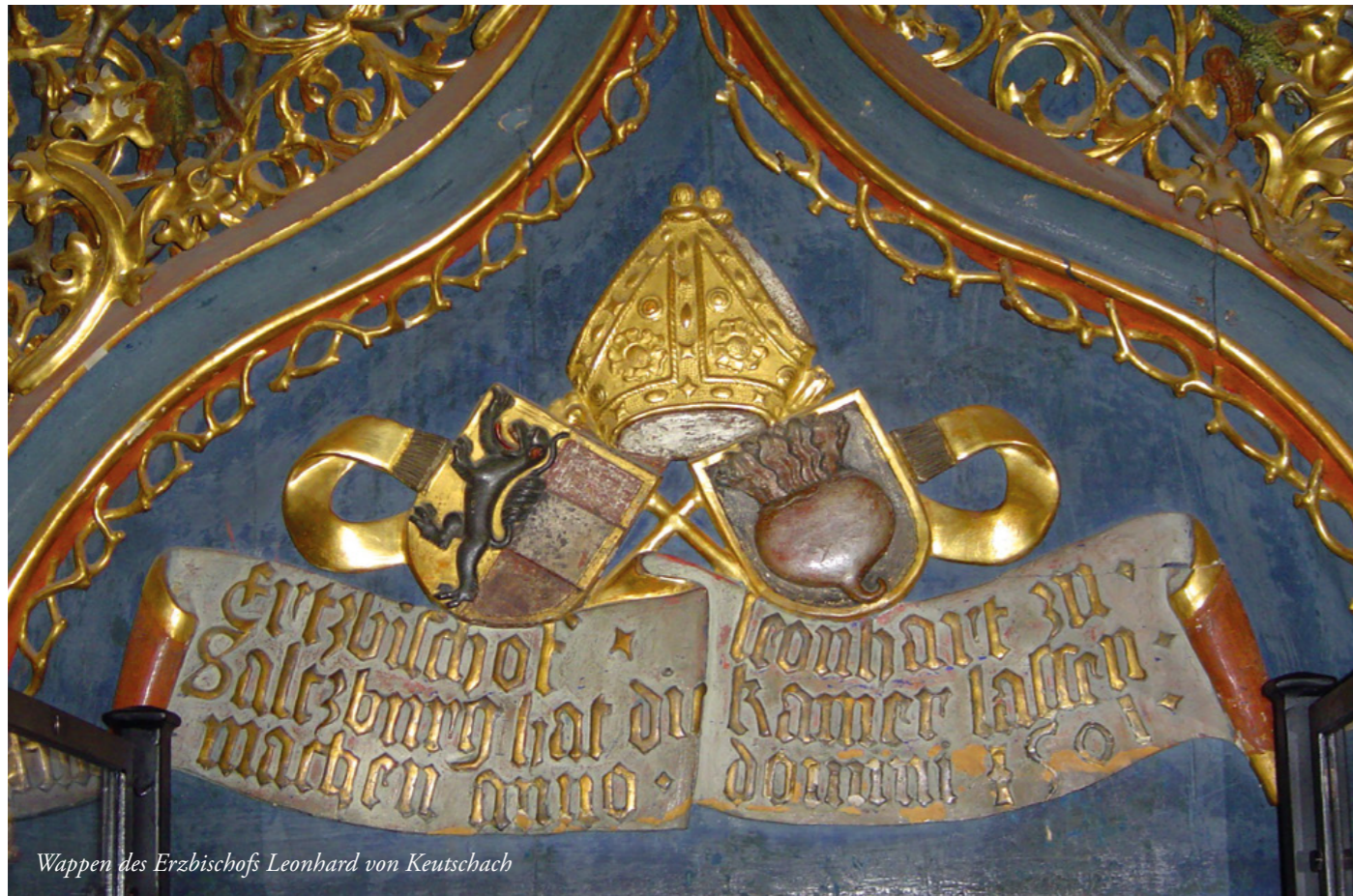
Wappen des Erzbischofs Leonhard von Keutschach

Durch seine kluge Politik gelingt es Paris aber, Salzburg den Frieden zu erhalten. 1622 gründet er die Universität Salzburg.