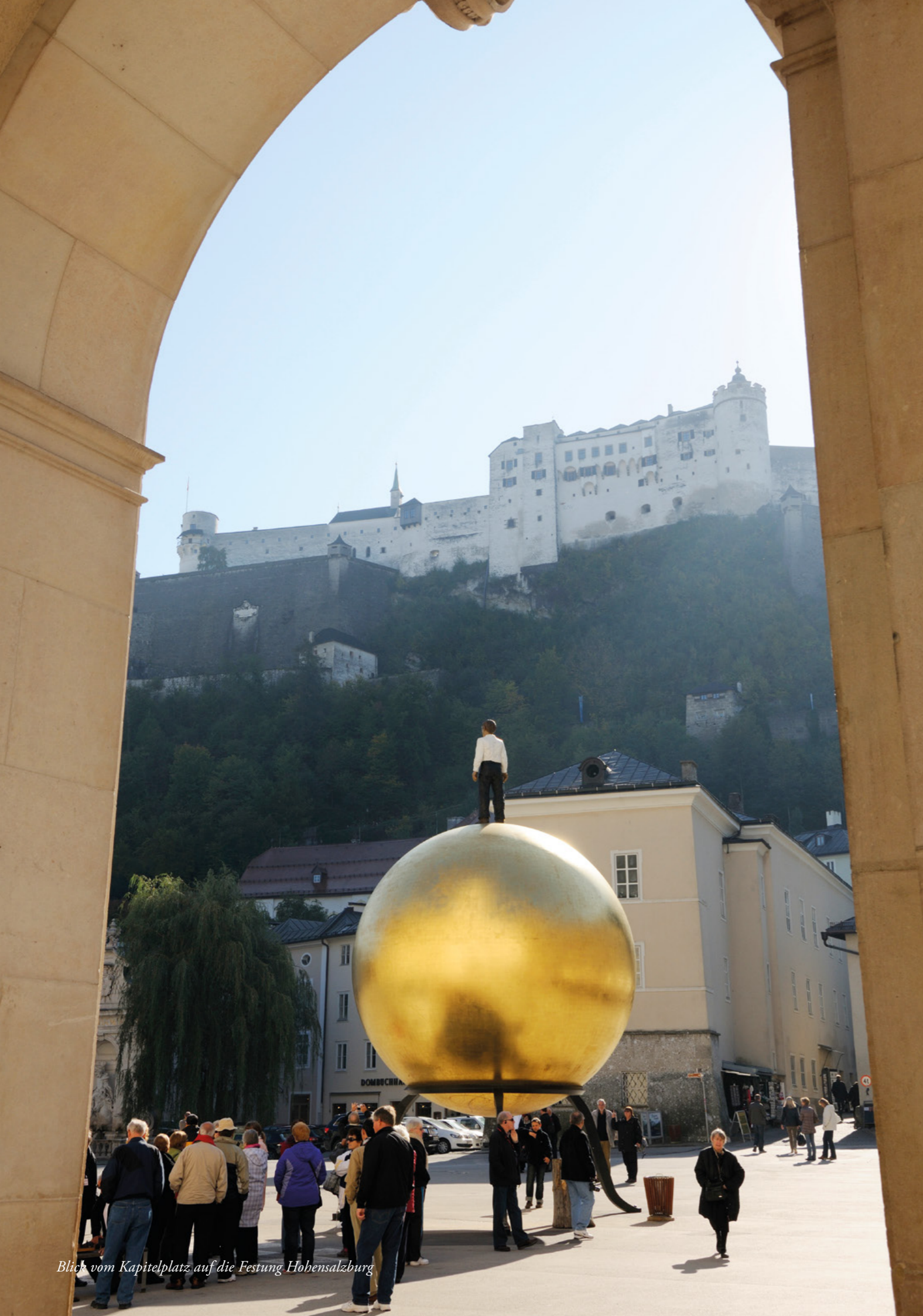
Blick vom Kapitelplatz auf die Festung Hohensalzburg