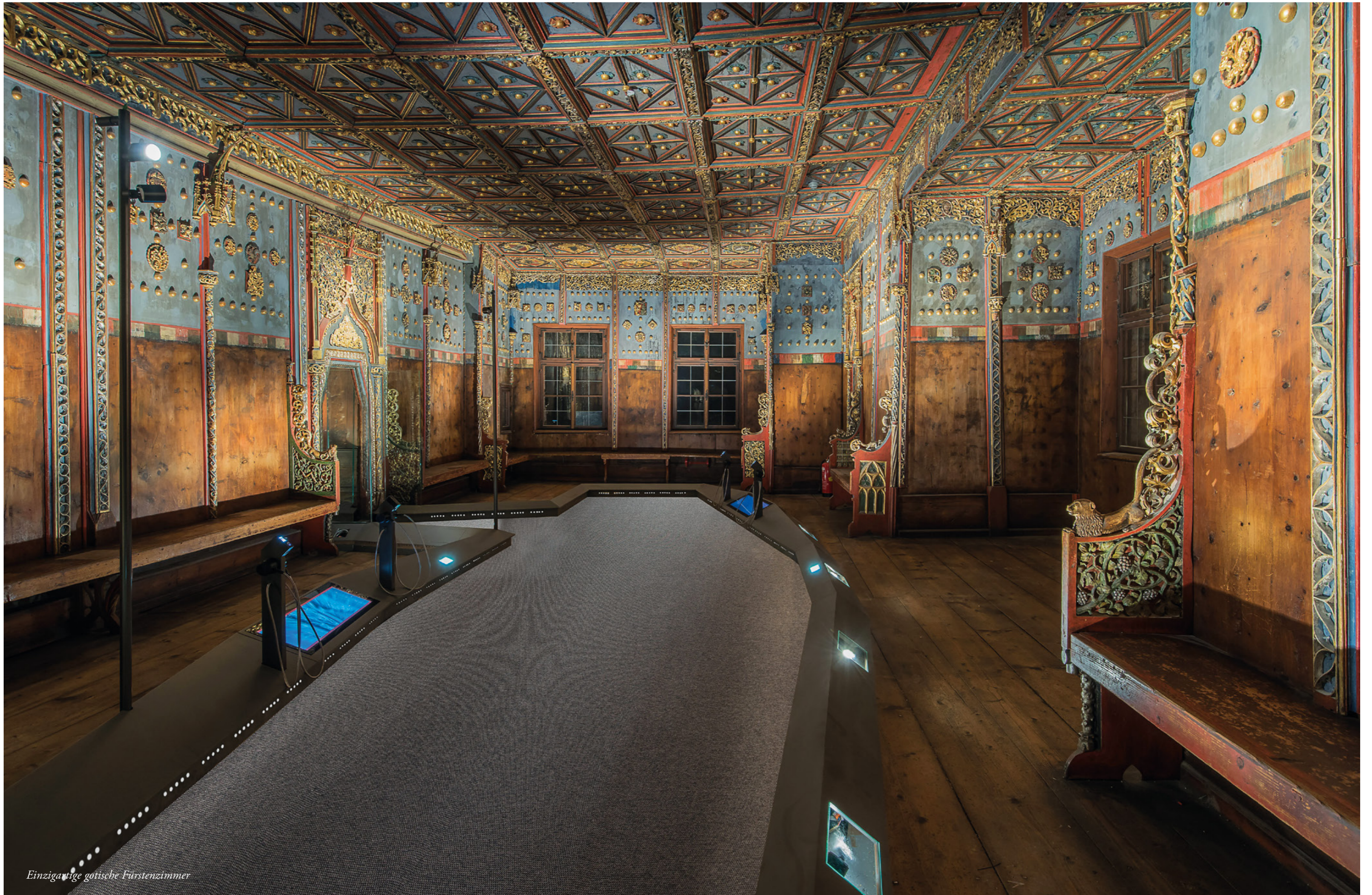
Einzigartige gotische Fürstenzimmer