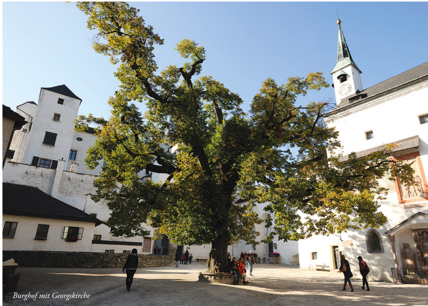
Burghof mit Georgskirche

tung Hohensalzburg fort. Durch die Anlage des 450 m langen hochromanischen äußeren Festungsringes wird im 12. Jahrhundert bis zum 13. Jahrhundert die heutige Ausdehnung der Burg weitgehend festgelegt, in der damals über 30 Ministeriale, Beamte und Verwalter des Erzbischofs lebten, die über eigene repräsentative Bauten verfügten. Es gab Stallungen, Scheunen und Handwerksbetriebe. Unter der Regentschaft von Eberhard II. (1200–1246) besteht die Festung aus dem Wohnturm, einem gemauerten Palas von 28 Meter Länge, dem repräsentativen Saalbau einer mittelalterlichen Burg, in dem die Regierungshandlungen oder der Empfang weltlicher und geistlicher Würdenträger stattfinden, sowie aus der Kapelle und Nebengebäuden.