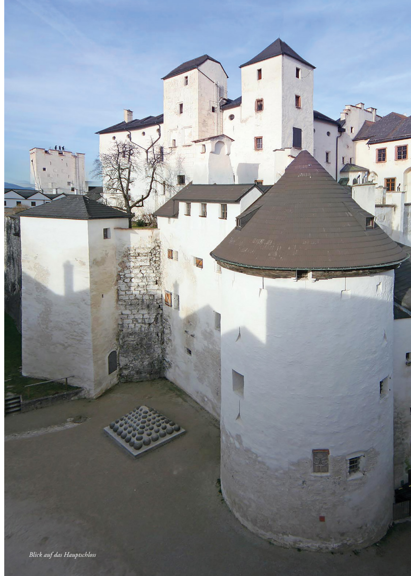
Blick auf das Hauptschloss

Ihr endgültiges Aussehen erhält die Festung unter Leonard von Keutschach, Salzburger Erzbischof von 1495 bis 1519. Der tiefgläubige Erzbischof, der sein Leben lang nach der Augustiner-Chorherren-Regel lebt, lässt 1498 alle Juden vertreiben, die Synagogen in Hallein und Salzburg werden zerstört. Seine neuen Wirtschaftsmaßnahmen führen zu Wohlstand und zu einer ersten großen Blüte der Kunst und Kultur in Salzburg, das zu einem der reichsten Fürstentümer des Römisch-Deut-