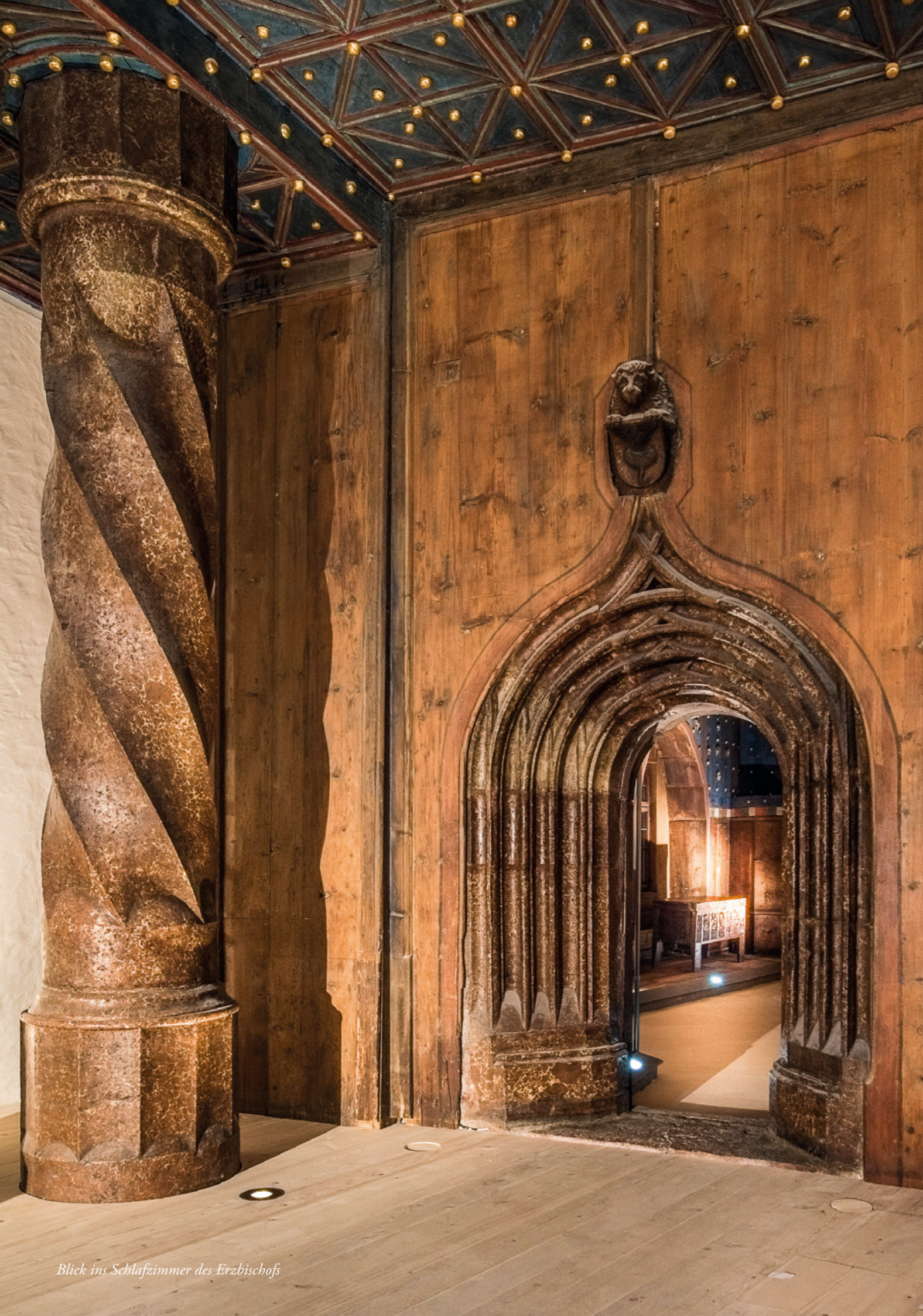
Blick ins Schlafzimmer des Erzbischofs